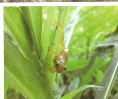
アカガエルの仲間