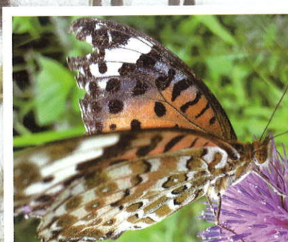
ツマグロヒョウモン