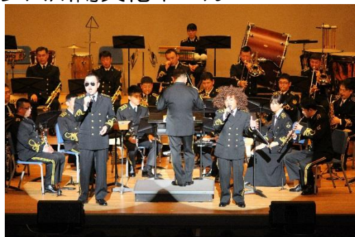
(写真は昨年の様子です。)