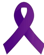
パープルリボン 女性に対する暴力をなくす運動

暴力には、身体的なものだけでなく、威圧的な態度や言葉の暴力といった精神的暴力、性的暴力、経済的暴力、社会的に孤立させる暴力なども含まれます。暴力による被害者を救済することは言うまでもなく、暴力を許さない地域社会の意識醸成等未然防止の取組が重要です。