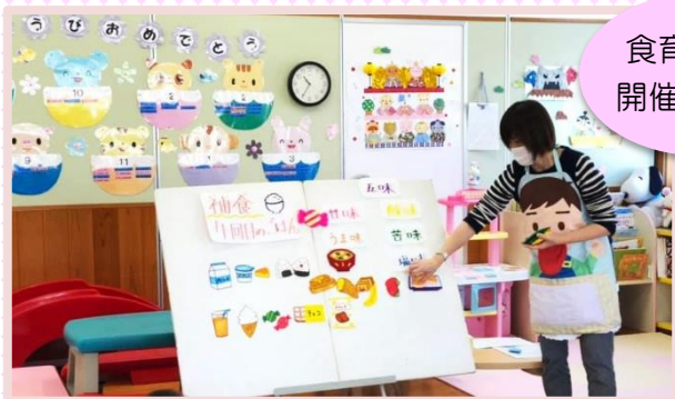
食育講座を開催しました