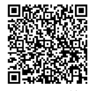
ケアルームこどもん