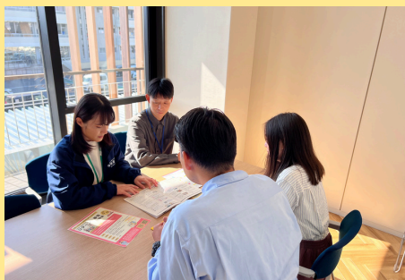
川南町役場での移住相談対応