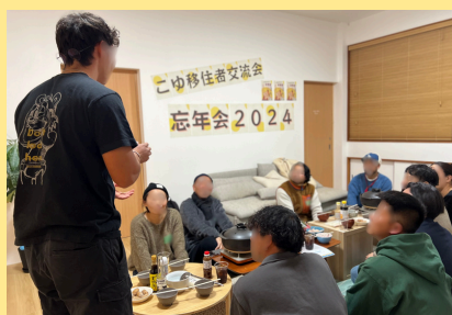
移住者交流会の開催