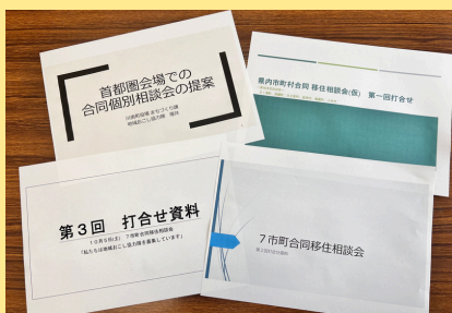
ゼロをイチにする経験