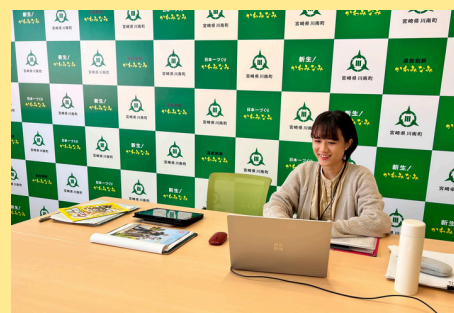
オンラインでの移住相談対応