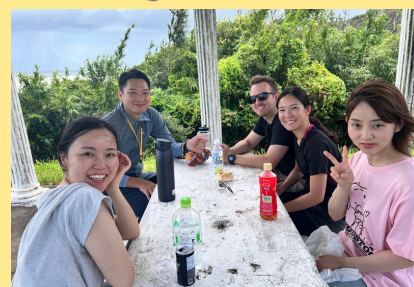
地域体験プログラムの実施