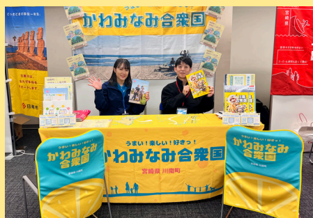
首都圏での移住相談会に出展