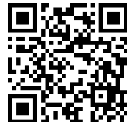
施設見学申込 専用フォーム QRコード