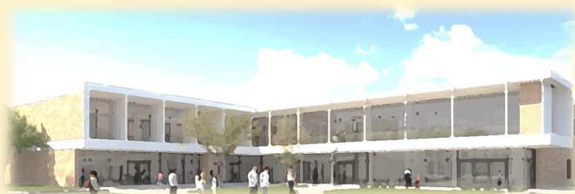
イラストはイメージです